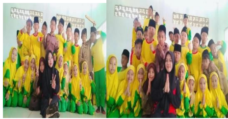
Gambar 2.1-2.2 Sosialisasi anti bullying di Madrasah Ibtidaiyah Al-Huda (26/07/2025)