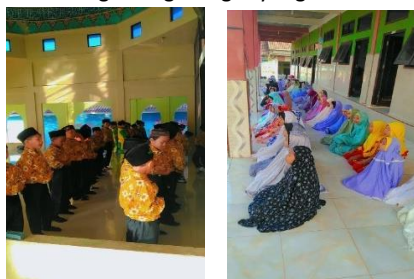
Gambar 6.1-6.2 Pembiasaan sholat dluha di Madrasah Ibtidaiyah Al-Huda(31/07/2025)