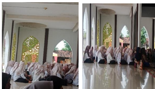
Gambar 1.1-1.2 Koordinasi Bersama pengurus pondok mengenai bahayanya bulliying(25/07/2025)