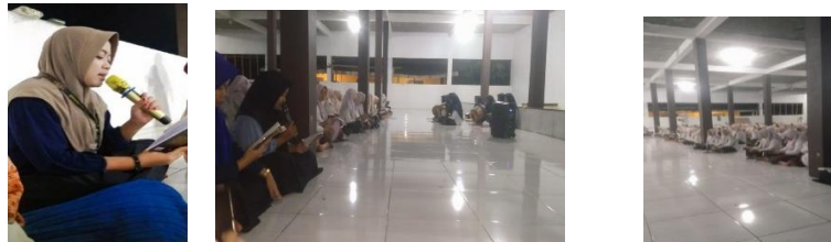
Gambar 3.1-3.3 Sholawat bersama(27/07/2025)