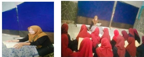
Gambar 4.1-4.2 Kajian hadist tentang persaudaraan (28/07/2025)