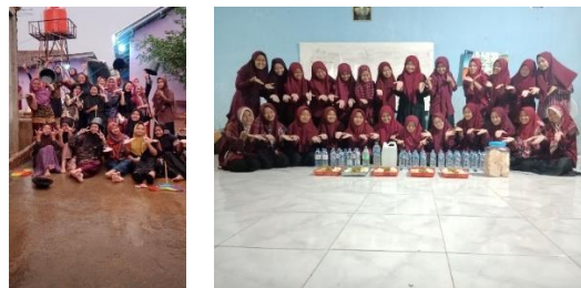
Gambar 5.1-5.2 Kegiatan gotong royong dan makan bersama(29/07/2025)