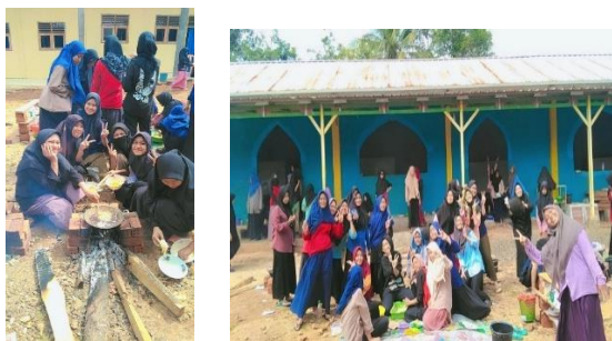
Gambar 8.1-8.2 Kegiatan masak-masak((16/08/2025)