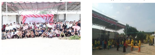
Gambar 9.1-9.3 Perayaan Hari Kemerdekaan dan lomba(17/08/2025)