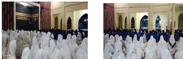
Gambar 7.1-7.2 Sosialisasi di kelas diniyah mengenai pentingnya mencegah bullying(1/08/2025)