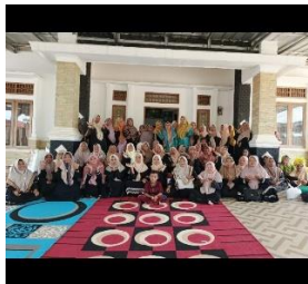
Gambar 10.1-10.2 Sosialisasi kepada jamaah ibu-ibu dan wawancara