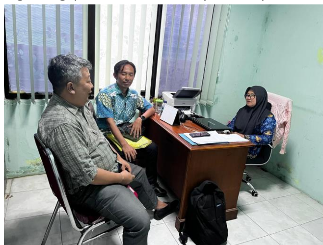
Gambar 1: Kegiatan Pendampingan Administrasi Perizinan Dokumen Lingkungan di Dinas Lingkungan Hidup Kabupaten Cirebon

Dinas Lingkungan Hidup (DLH) Kabupaten Cirebon berperan sebagai salah satu unsur pelaksana dari elemen pemerintahan daerah yang mempunyai tugas pokok menyelenggarakan urusan pemerintahan di bidang lingkungan hidup. DLH Kabupaten Cirebon dituntut untuk senantiasa berusaha memberikan pendampingan dalam rangka mengendalikan lingkungan hidup di Kabupaten Cirebon agar tidak terjadi kerusakan lingkungan. (Rumaisa et al., 2019) DLH Kabupaten Cirebon, khususnya melalui Bidang Tata Lingkungan juga berperan penting dalam proses penilaian, verifikasi, dan penerbitan rekomendasi dokumen lingkungan bagi pelaku usaha di wilayah Kabupaten Cirebon.