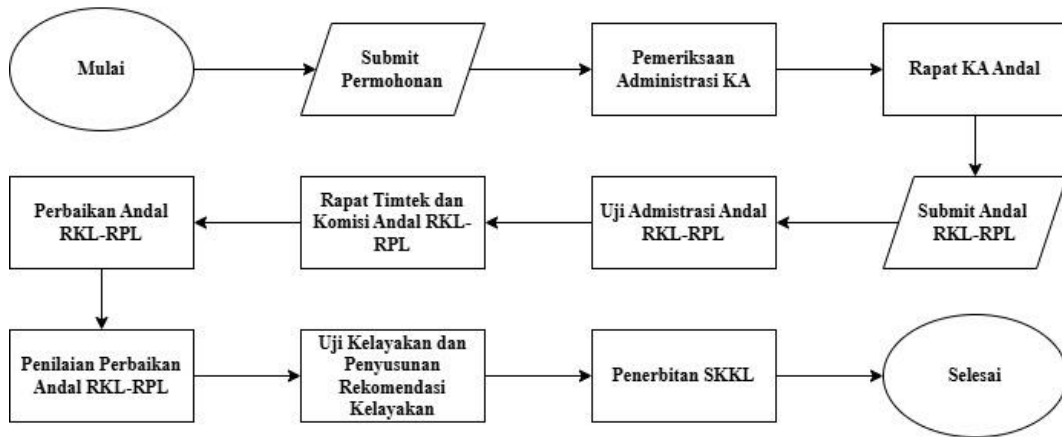
Gambar 2: Alur Proses Pengajuan Dokumen Amdal

Materi selanjutnya adalah tata cara perizinan UKL-UPL yang ditujukan bagi kegiatan yang tidak wajib memiliki analisis mengenai dampak lingkungan (AMDAL). (Amirilis, 2023) Hasil kegiatan menunjukkan bahwa peserta lebih banyak termasuk dalam kategori usaha yang memerlukan dokumen UKL-UPL. Penyampaian alur perizinan UKL-UPL membantu peserta memahami prosedur administrasi yang harus dipenuhi sebelum menjalankan kegiatan usaha.